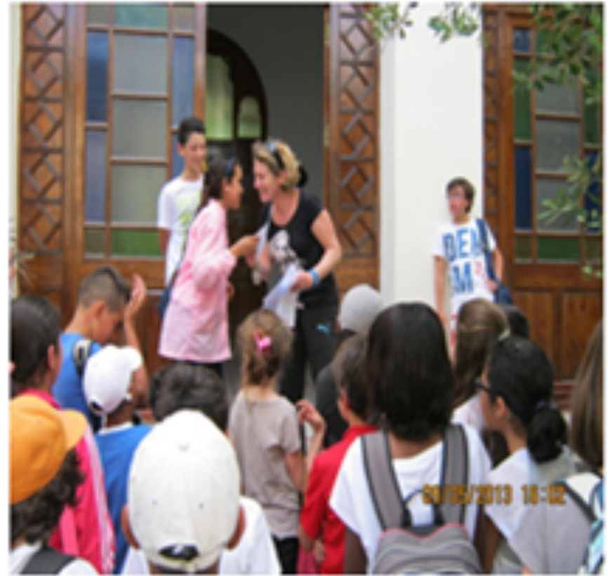
VISITES D'ECHANGES ENTRE NOS ELEVES ET CEUX DE LA MISSION FRANCAISE