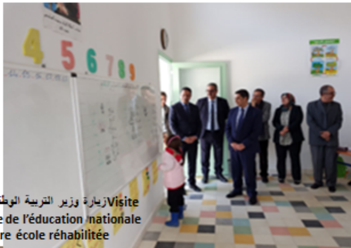
زيارة وزير التربية الوطنية للمؤسسة Visite du ministre de l'éducation nationale à notre école réhabilitée